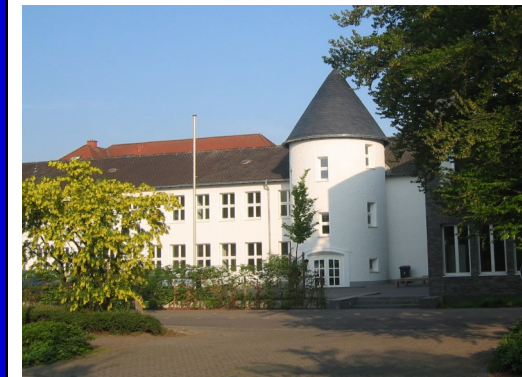
August Vetter Berufskolleg Bocholt