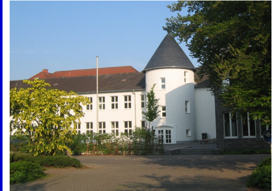
August Vetter Berufskolleg Bocholt